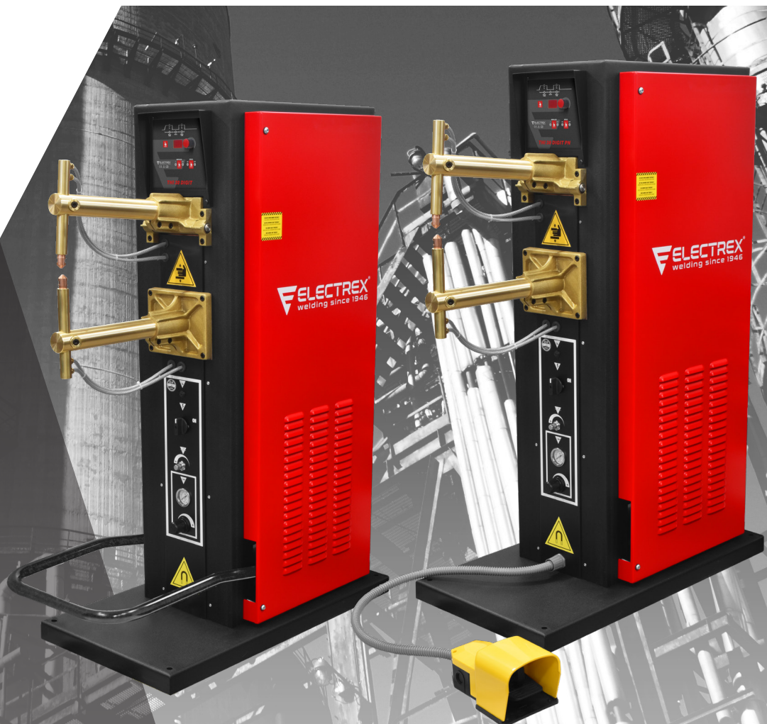
THI 30 DIGIT